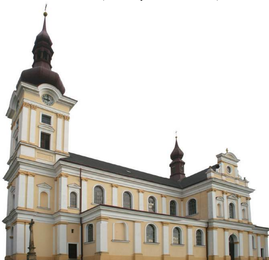
PAROECIA SANCTI BENEDICTI PUSTIMER (CZ)

VENEZIA (1 - bazilika sv. Marka); BOLOGNA (2 - bazilika sv. Dominika), MANOPELLO (3. - svatyně Svaté Tváře); SAN GIOVANNI ROTONDO (4.- chrám sv. Pia z Pietrelciny); MONTE SANT'ANGELO (5. - svatyně sv. Michaela, archanděla) MONTECASSINO (6. - katedrála: hrob sv. Benedikta); ROMA (7 - bazilika Santa Maria Maggiore: Salus Populi Romani); ORVIETO (8. katedrála - kaple Svatého Korporálu); PADOVA (9. - svatyně sv. Antonína)