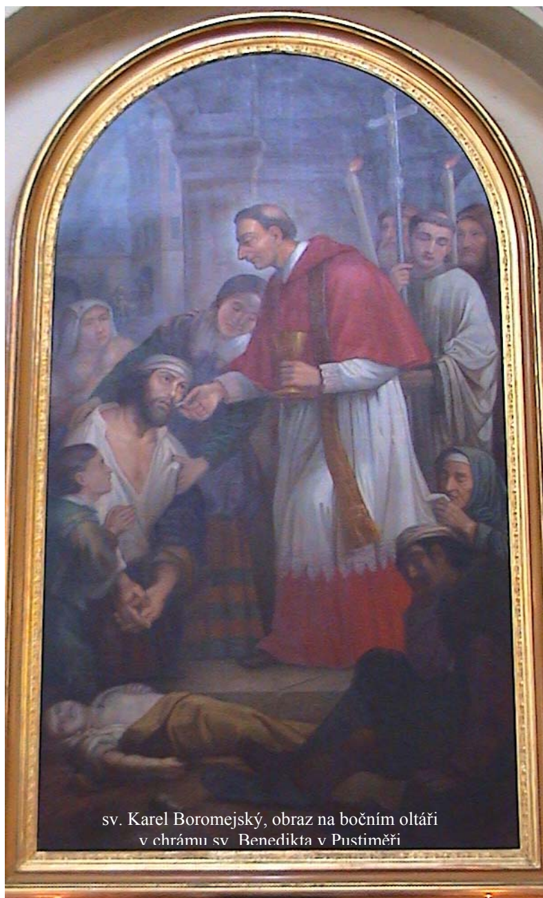
sv. Karel Boromejský, obraz na bočním oltáři v chrámu sv. Benedikta v Pustiměři

Zdá se, že mladý kardinál nějakou dobu pomýšlel na to, že se vzdá přílišných úradů, které jej držely u papeže, na římském dvoře, který se mu nelíbil, a že se chtěl uchýlit ke kontemplativnímu životu, zřejmě k řádu kamaldulských mnichů. Přesvědčil ho biskup z Bragy, Bartolomeo de Martyribus, který přišel do Říma z Tridentu v roce 1563. Tento svatý muž zastával na koncilu mínění, že biskupové mají vážnou povinnost osobně spravovat svou diecézi a stabilně v ní sídlit. Mladý Boromejský i díky němu pochopil, že pastorační činnost není než neustálým vykonáváním těch nejvyšších ctností. Byl to právě de Martyribus, který přivedl Boromejského k tomu, aby se nezříkal milánského arcibiskupství, které mu papež svěril „in commenda“ (jako obročí), a kterého se Karel ujal prostřednictvím správce už v únoru 1560.