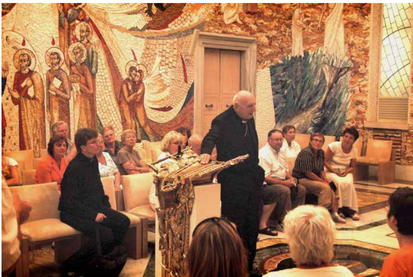
PEREGRINATIO AD LIMINA APOSTOLORUM: s kardinálem Špidlíkem v kapli Redemptoris Mater, 13.6.2007

Hned po slovech „ Slovo se stalo tělem..... “ z evangelia sv. Jana (Jan 1,14), zůstává nejvýznamnějším biblickým textem vánoční doby úryvek z listu Židům 1,1-2: „Bůh, jenž v minulosti mluvil ..... skrze proroky, v této, to je poslední době, promluvil k nám skrze Syna“. Ve světle tohoto úryvku, a vycházející z knihy Benedikta XVI. o Ježíši z Nazareta, je snahou těchto adventních promluv osvětlit novost a jedinečnost Krista, jak vyvěrají z konfrontace s proroky a s Janem Křtitelem, a s užíváním titulu „Syn“. Duchovním plodem by měla být víra a ještě hlubší přílnutí k osobě Spasitele.